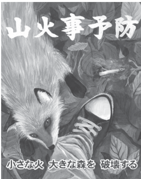
「平成30年山火事予防ポスター」

この運動は全国的に山林等の火災が多発し、火入れや入山者の増加等が見込まれることから、室生赤目、青山国定公園をはじめとする貴重な山林を火災から保護し、山林関係者及び管内住民等に対して火災予防思想のより一層の普及を図ることを目的として活動します。