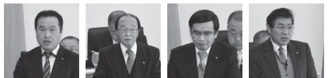
左から 曾爾御杖行政一部事務組合・宇陀衛生一部事務組合・東宇陀環境衛生組合・奈良県広域消防組合担当議員

り、また知識や経験は貴重な財産だと感じています。今後も、健康に留意され益々のご活躍をご期待いたします。