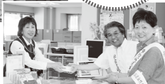
▲郵便局へ啓発物品の配布を依頼

社会を明るくする運動は、犯罪の防止、罪を犯した人たちの更生について理解を深め、それぞれの立場において力を合わせ犯罪のない明るい社会を築こうとする全国的な運動です。