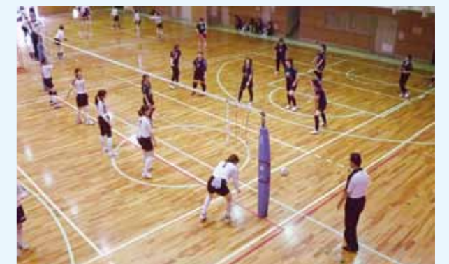
7月14日(日)葛城市民体育館 バレーボール女子の部 宇陀郡 0-2 奈良市 平田みのりさん：「優勝候補と対戦できていい経験ができました。来年に向け頑張ります。」