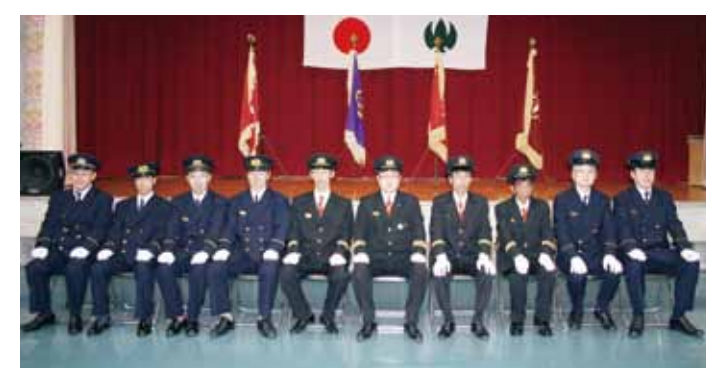
平成25年度 新幹部の皆さん

入園・入学おめでとう ① / 議会だより ② / 人事異動 ④ / 保健福祉課より ⑥～⑦ / 住民生活課より ⑧～⑨ / お知らせ ⑩～⑬ / みつえニュース ⑭