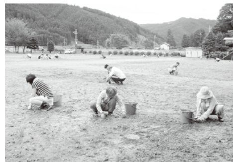
8月30日（日曜日）中学校奉仕作業（除草作業）