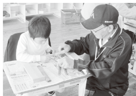
1年生 生活科 竹トンボを作って遊ぼう