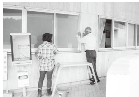
9月6日（日曜日）小学校奉仕作業（ガラス拭き）