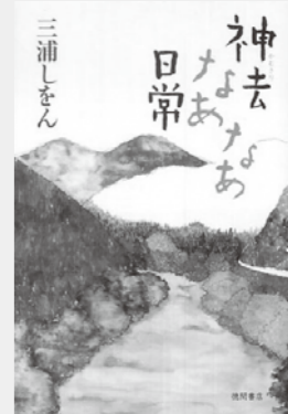
「神去なあなあ日常」 著者/三浦しをん

「これは、私たちの村の話だ！」本 を読んだ私はそう思った。 ケイタイもつながらず、コンビニ もない山奥に「放り込まれた」19歳 の勇氣(ゆうき)。個性豊かな神去 村の人たちに囲まれ、林業を学びな がら成長していく勇氣の姿を描く。 自然の中で働く人々。自然を守 り、感謝しながら、時には恩恵を いただきながら神去村で生きる田舎の 様子が、美しい季節の移ろいと、共 にのほほんと言われながらも、また