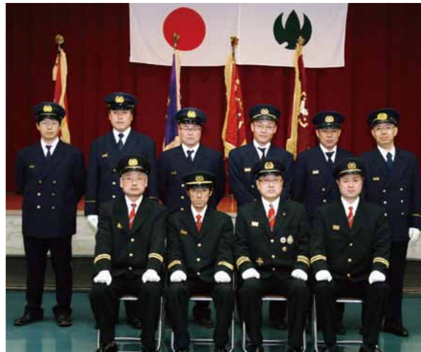
平成26年度 新幹役員