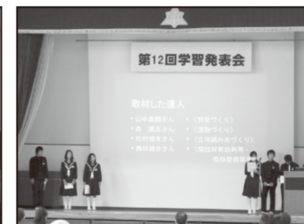
中学校学習発表会

12月8日、小学校マラソン大会に声援と見守りかねて参加しました。1年生から6年生まで寒い中、元気に走っている姿に感動しました。