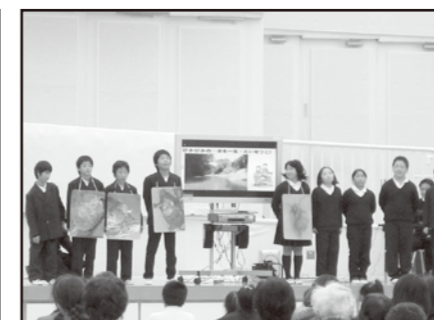
小学校学習発表会