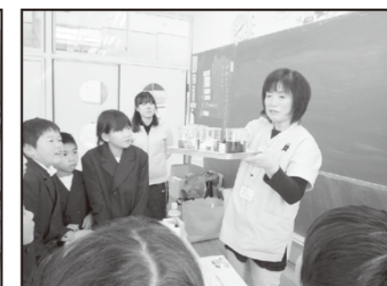
低学年の薬物乱用教室

12月9日、小学校の低学年の生徒と「薬の正しい飲み方」について実験をまじえて学習しました。手にはたくさんのばい菌がいることを知ってもらい「しっかり手洗いしないと手はきれいにならない」ということを改めて学びました。