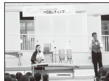
青少年劇場小公演事業 ひとりオペラ「ペロ出しチョンマ」

12月13日、中学校の学習発表会に参加しました。環境・自然・歴史文化・情報発信の4つのグループに分かれ活動したことを発表してくれました。学校での取り組みもたくさんの人に知って貰えるよう、ホームページも紹介していました。小学校も中学校もふるさと御杖村を愛し、関心を持って勉強していることがよくわかりました。