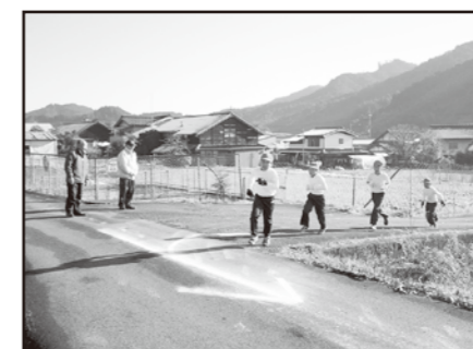
小学校マラソン大会

12月8日、小学校マラソン大会に声援と見守りかねて参加しました。1年生から6年生まで寒い中、元気に走っている姿に感動しました。