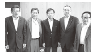
曾爾村正副議長と伴に村井副知事を訪問(5月11日 議長・副議長)