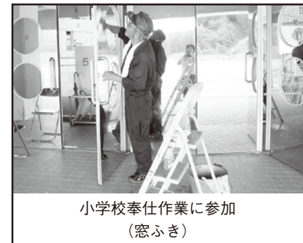
小学校奉仕作業に参加 (窓ふき)