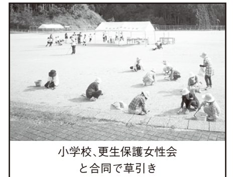
小学校、更生保護女性会 と合同で草引き