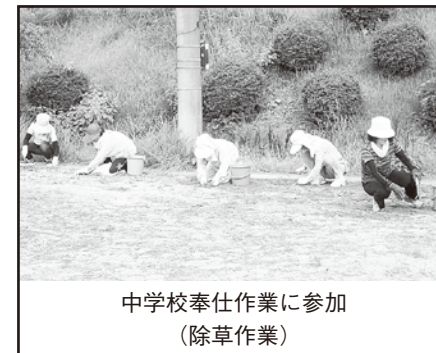
中学校奉仕作業に参加 (除草作業)

今年は小学校の運動会前に更生保護女性会と学校支援ボランティア合同で草引きをしました。子ども達の日々の学校生活や保・小・中合同秋季体育大会が気持ちよく行われたことと思います。