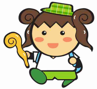
御杖村の「えみちゃん」